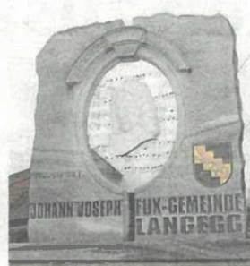
Mitwirkung bei Johann-Joseph-Fux-Digitalisierung in St. Marein LA