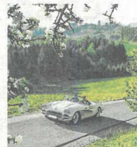
Auch die Hügelland Classic wurde begleitet. HügelLand-Classic